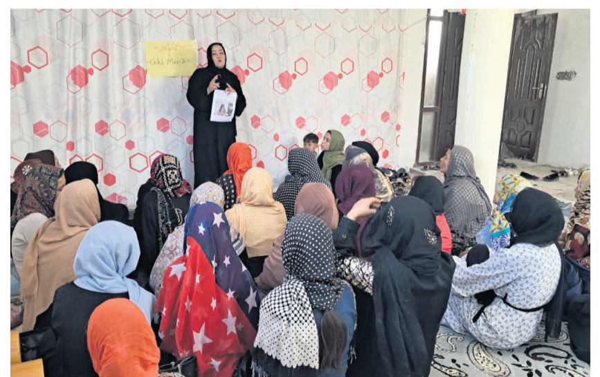
Teilnehmerinnen einer Selbsthilfegruppe werden zu den Folgen geschlechtsspezifischer Gewalt und Kinderehen geschult.

Langfristig zielt das Projekt darauf ab, einen sich selbst tragenden Prozess der Stärkung anzustossen, sodass die Gruppen auch über die Projektlaufzeit hinaus bestehen bleiben und ihre Gemeinschaften weiter unterstützen.