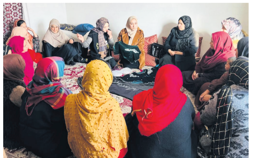
Stickerei-Kurse ermöglichen den Teilnehmerinnen der Selbsthilfegruppen, ein eigenes Einkommen zu erwirtschaften